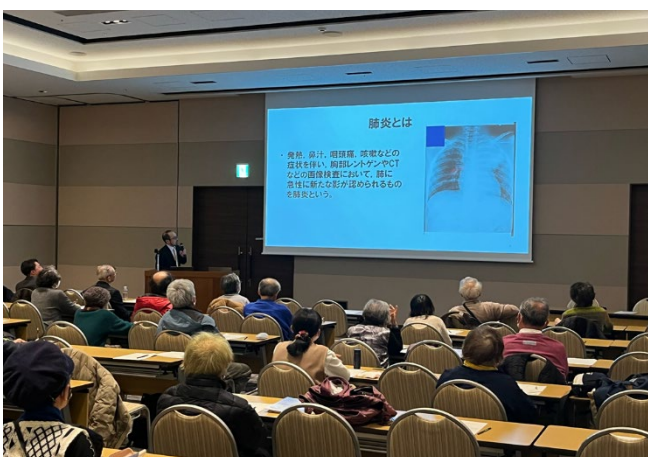
○肺炎予防のための新しいワクチン